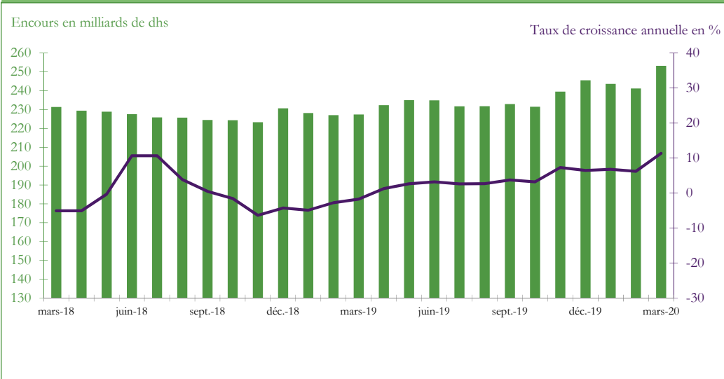
Graphique 3 : EVOLUTION DES RESERVES INTERNATIONALES NETTES